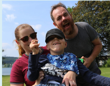
Bei der Pfingstfahrt zum Mönesee hatten alle gute Laune und viel Spaß