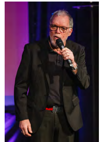
Comedian Wolfgang Trepper